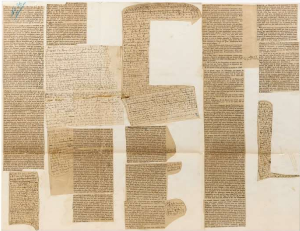
Placard du manuscrit d' À l'ombre des Jeunes filles en fleurs

Salle Nadar de la Maison de tante Léonie