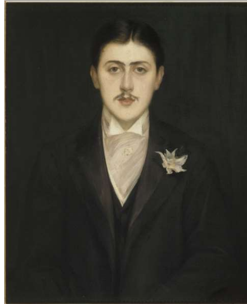
Portrait de Proust par Jacques-Emile Blanche (prêt exceptionnel du musée d'Orsay)

du Printemps proustien (manifestations organisées sous l'égide du département d'Eure-et-Loir, en lien avec la SAMP, pour fêter le 100 e anniversaire du prix Goncourt décerné à Marcel Proust), visite libre de l'exposition « Marcel Proust, prix Goncourt 1919 »