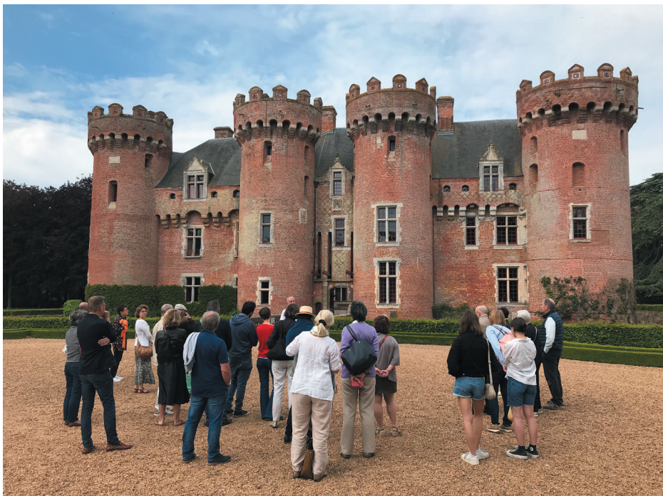
La visite du château de Villebon