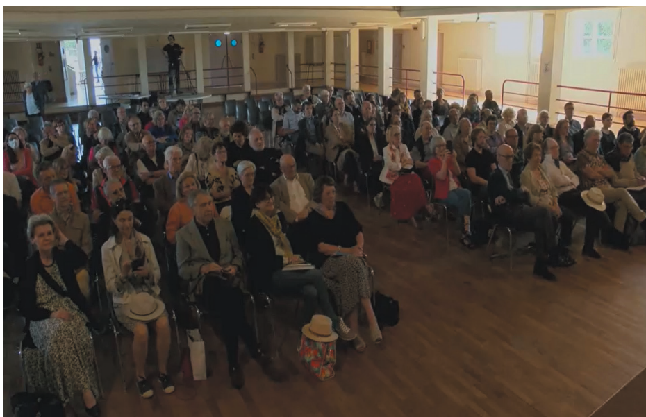
Les adhérents assistant à la conférence d'Antoine Compagnon